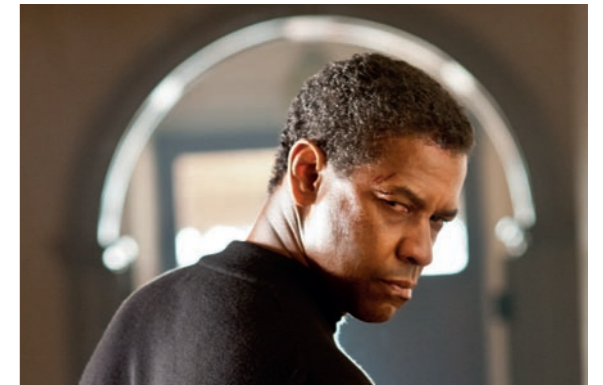
12 ◀ Safe House

Seite 26 Traumpalast Schorndorf Seite 27 Traumpalast Waiblingen Seite 28 Traumpalast Esslingen Seite 29 Traumpalast Nürtingen Seite 30 Traumpalast Biberach