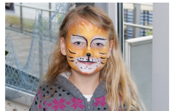
20 ◀ Kinder-Aktionstag „Der gestiefelte Kater“