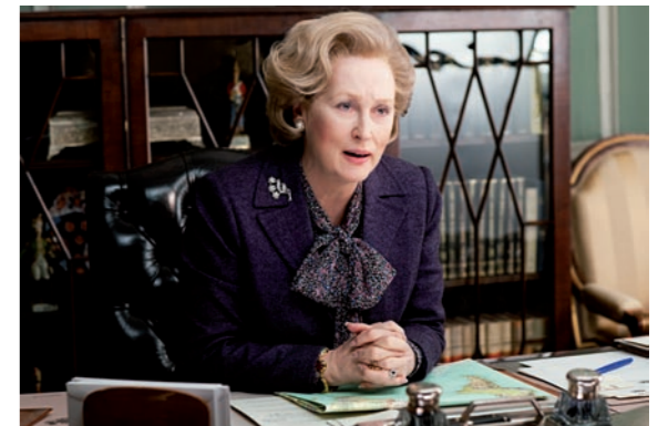
Kinohighlights 2012 ▶ 18